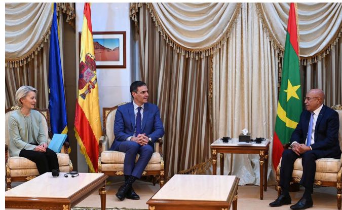
La presidenta de la Comisión Europea, Ursula von der Leyen y el presidente del Gobierno, Pedro Sánchez, junto al presidente de la República Islámica de Mauritania, Mohamed Ould Ghazouani, durante una visita conjunta a la República Islámica de Mauritania. Nuakchot (Mauritania) - 8.2.2024.

Durante la visita del presidente del Gobierno a Mauritania del 8 de febrero de 2024 se firmó el nuevo Marco de Asociación País (MAP) para el periodo 2024-2027, que prevé una dotación de 60M€ de Ayuda Oficial al Desarrollo. Los sectores de actuación preferente son la buena gobernanza y el fortalecimiento institucional, destacando los ámbitos de género, promoción del desarrollo rural, seguridad alimentaria y contribución al fortalecimiento y cobertura universal de un sistema público de salud equitativo. Asimismo,