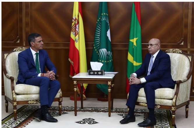
El presidente del Gobierno, Pedro Sánchez, y el presidente de la República Islámica de Mauritania, Mohammed Cheikh El Ghazouani durante la reunión que han mantenido en Nuakchott, el 27 de agosto 2024.

tante contribución para Mauritania de un total de 210M€. Posteriormente, el viaje a Mauritania de la Comisaria Johansson y el Ministro Grande-Marlaska, en marzo 2024, dio lugar a la firma de una Declaración conjunta estableciendo un partenariado en materia migratoria.