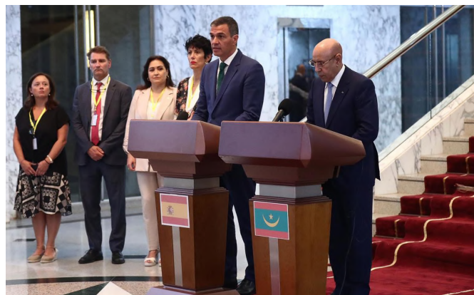
El presidente del Gobierno, Pedro Sánchez, junto al presidente de la República Islámica de Mauritania, Mohammed Cheikh El Ghazouani, durante la rueda de prensa con motivo de la visita de Pedro Sanchez, Nuakchott, 27 de agosto 2024.