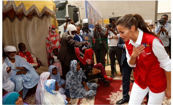
La Reina saluda a los presentes a su llegada a las inmediaciones de la Sociedad Nacional de Distribución de Pescado (SNDP) en Nuakchot, el 2 de junio de 2022.-